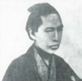
雲井龍雄(くもいたつお)

雲井龍雄は幕末の米沢藩士で、戊辰戦争時會津藩を助けようとして沼田街道を南下し、尾瀬越えの際に湯ノ花温泉に投宿したといわれている。その時に宿の娘と恋に落ちた物語が浪花節「恋の雲井龍雄」宮川右近作曲によりうたわれている。また雲井龍雄の詠んだ詩は今でも詩吟愛好家の間で愛されている。